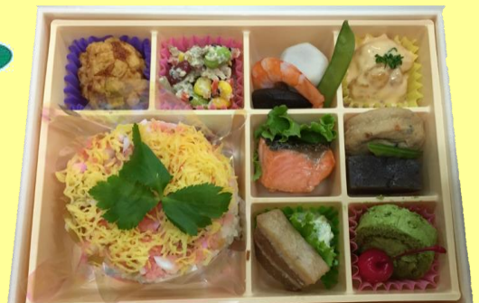
大村寿司会席 税込1400円