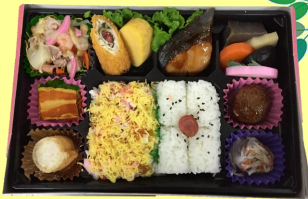
和華蘭弁当 税込1150円