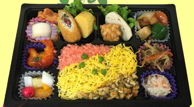
三色寿司弁当 税込1150円