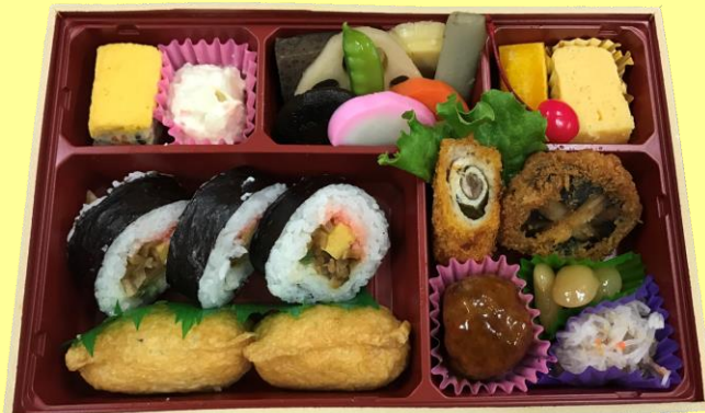
石だたみ (上) 税込1150円