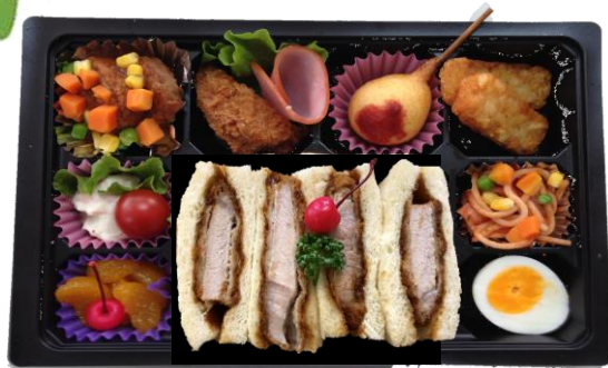
低温熟成豚のロースカツサンド 税込690円